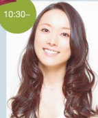
女優 高瀬媛子 (たかせあきこ)

1978年生まれ、女優。自身の美容と心身の健康管理のため、東洋医学アーユルヴェーダと出会う。その深遠な叡智に惹かれ、生きるすべての智慧の源である「アーユルヴェーダ式生活」を実践している。